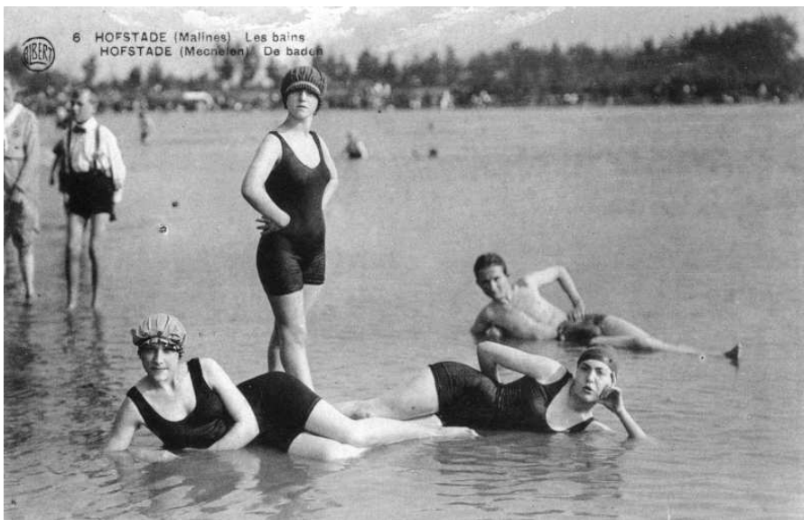
Momenteel loopt een proeftuin 'culturele diversiteit'. Uitgangspunt van deze proeftuin is dat het recreatiedomein in Hofstade (Zemst) een cultureel divers publiek trekt en dat dit altijd al zo is geweest. Voor deze proeftuin hebben Heemkring De Semse en Sportimonium de handen in elkaar geslagen. Andere partners zijn FARO, de provincie Vlaams-Brabant, de erfgoedcellen van Brussel en Mechelen en Heemkunde Vlaanderen vzw. Op de foto: enkele baders in Hofstade-les-Bains (jaren 1930).

Binnen Lokaal Geheugen wordt ook gesleuteld aan proeftuinen. Een 'proeftuin' is een project met een of meerdere lokale erfgoedorganisaties over een welbepaald onderwerp, zoals mondelinge geschiedenis, etnisch-culturele diversiteit, presentatietechnieken ... De bedoeling is inspirerende methodes en inhoud op kleine schaal te ontwikkelen, uit te testen en te evalueren.