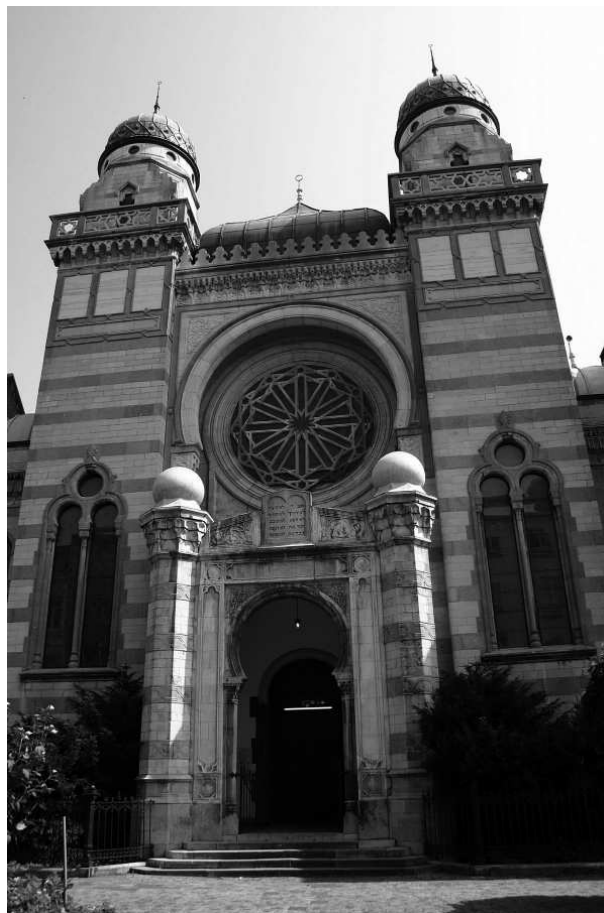
de Hollandse Synagoge aan de Bouwmeesterstraat in Antwerpen

Meer info over de Europese route van het joods erfgoed is te vinden op www.jewishheritage.org